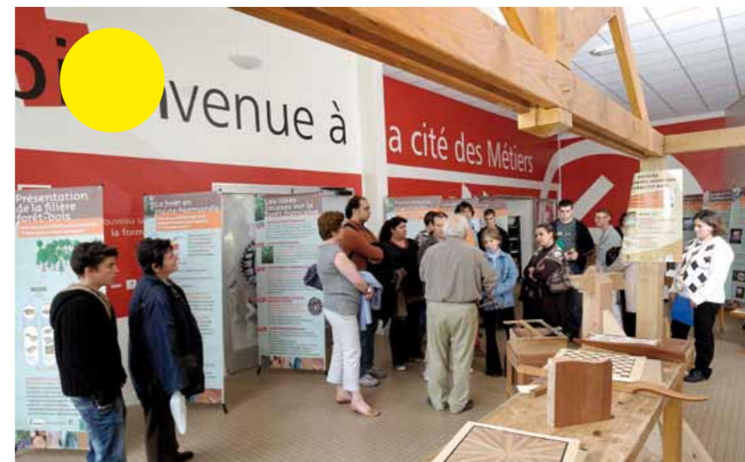
Cité des métiers Haute-Normandie (France)

Sont considérées comme des situations de préfiguration : l'ouverture progressive des pôles, l'organisation de permanences, d'animations permettant le test en grandeur réelle et/ou une montée en charge progressive de l'activité.