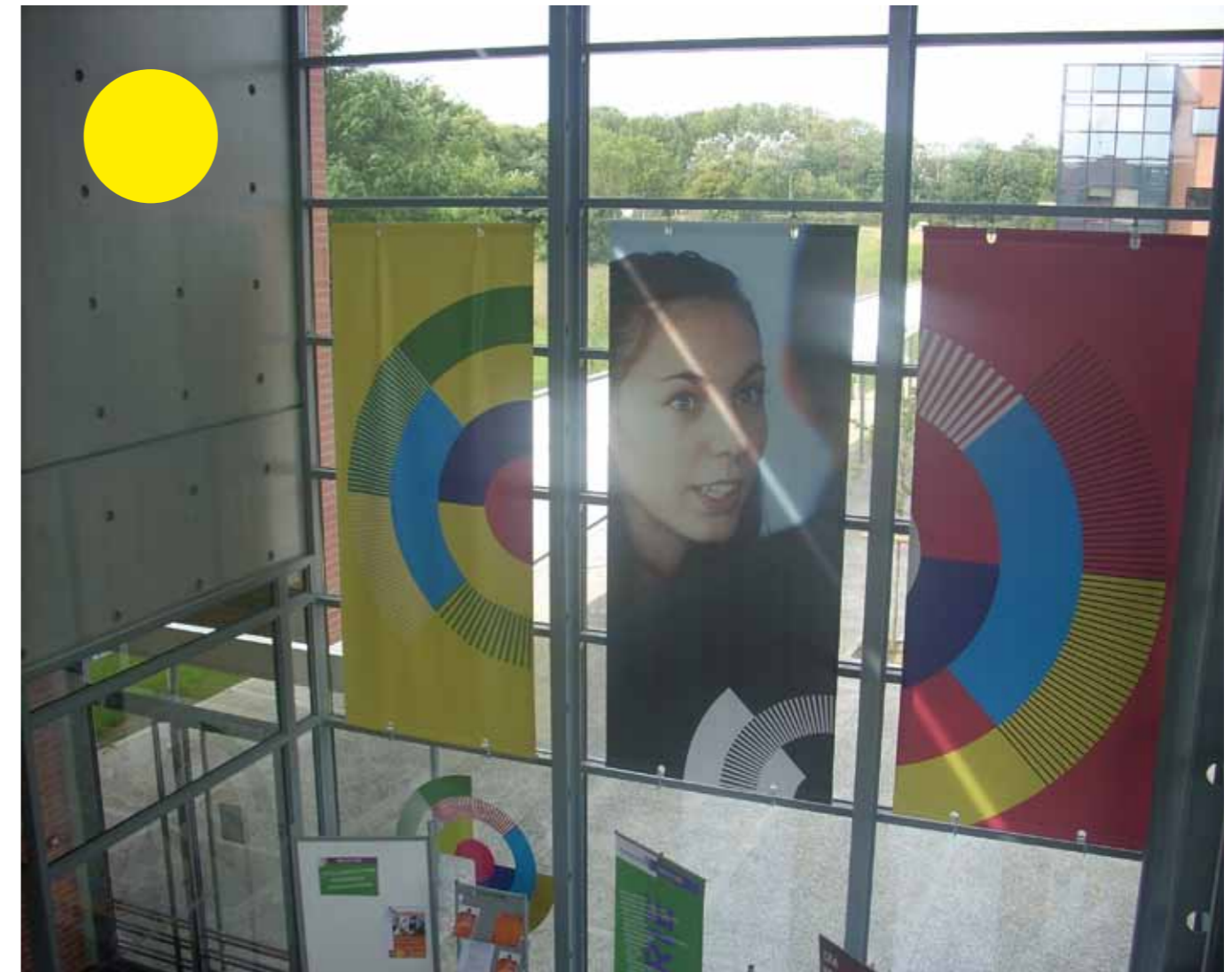
Cité des métiers Seine-et-Marne (France)

Les conseillers doivent être volontaires pour participer à une structure multipartenaire qui, bien souvent, bouscule les comportements et fonctionnements professionnels habituels de chaque institution. Un effort constant de mutualisation doit être mis en place afin de garantir l'efficacité de la coopération.