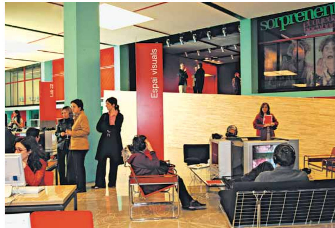
Cité des métiers Barcelone (Espagne)

Une des spécificités des Cités des métiers est de construire une offre et un projet à partir des préoccupations réelles des publics et le moins possible à partir de tel ou tel découpage institutionnel ou politique. Elles se définissent donc en fonction des bassins d'emploi et de vie des habitants.