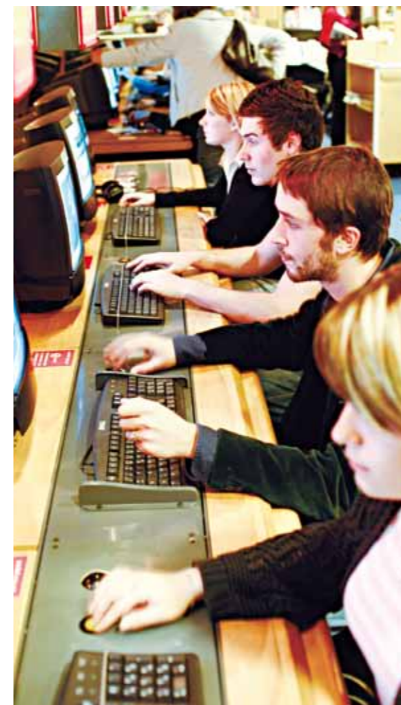
Cité des métiers La Villette-Paris (France)

Une Cité des métiers regroupe en un même lieu, les ressources, les outils, les spécialistes et les compétences nécessaires pour traiter de tous les aspects de la vie professionnelle : recrutement, stages, évolution des métiers, des professions et des qualifications, orientation, reconversion, formation professionnelle, création d'activité. Elle ne peut donc être ni spécialisée sur un thème (l'automobile, l'artisanat, l'environnement), ni sur un seul champ de la vie professionnelle (l'orientation, la formation ou l'emploi).