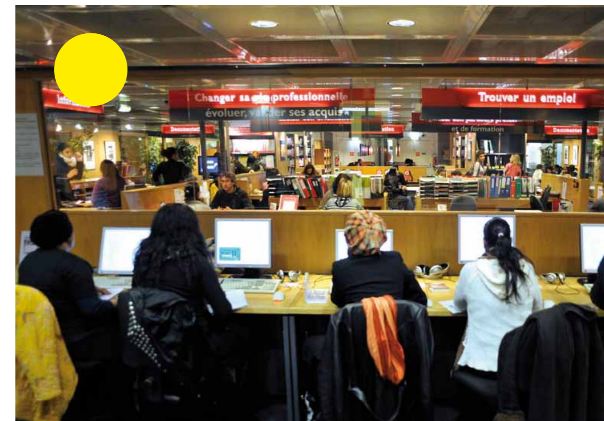
Cité des métiers La Villette-Paris (France)

Afin de proposer des services au plus près de tous les habitants de leur territoire et de réduire ainsi les inégalités d'accès à la formation et à l'emploi entre les différentes populations, les Cités des métiers ont développé différentes stratégies. En plus d'organiser des événements délocalisés et développer des accès diversifiés via internet, plusieurs d'entre elles ont souhaité démultiplier leurs lieux d'accueil physique des publics. Deux schémas ont été expérimentés : le premier a consisté à ouvrir des "centres associés" autour de la Cité des métiers fonctionnant alors localement comme tête de réseau. Ils ne proposent pas le même niveau de service mais fonctionnent comme relais locaux de l'offre. Le second schéma a consisté à dédoubler à l'identique la Cité des métiers en créant une ou plusieurs, offrant chacune, dans des "sites" géographiques différents, la totalité des services.