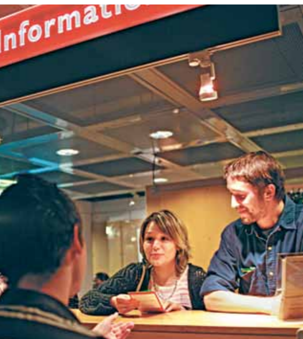
Cité des métiers La Villette-Paris (France)

Avec 4 millions d'utilisateurs sur ces quinze premières années, la Cité des métiers - la Villette-Paris a fait ses preuves comme lieu d'écoute et d'information pour l'orientation, l'insertion et l'évolution professionnelle. Elle se situe dans la logique de l'éducation permanente et vise à favoriser l'autonomie des personnes dans une logique d' empowerment .