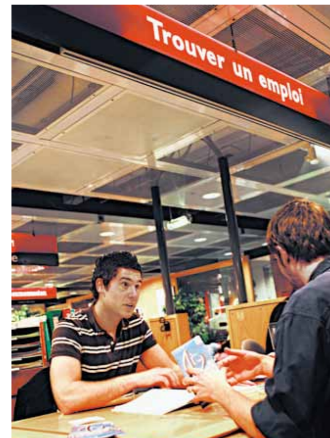
Cité des métiers La Villette-Paris (France)

L'objectif d'autonomisation des usagers est ce qui justifie l'existence d'une Cité des métiers. L'entretien doit aider l'usager à construire des stratégies d'action. Pour qu'il y ait véritablement conseil, il ne peut y avoir d'enjeu, de contrôle, de décision du conseiller pris à la place de l'usager.