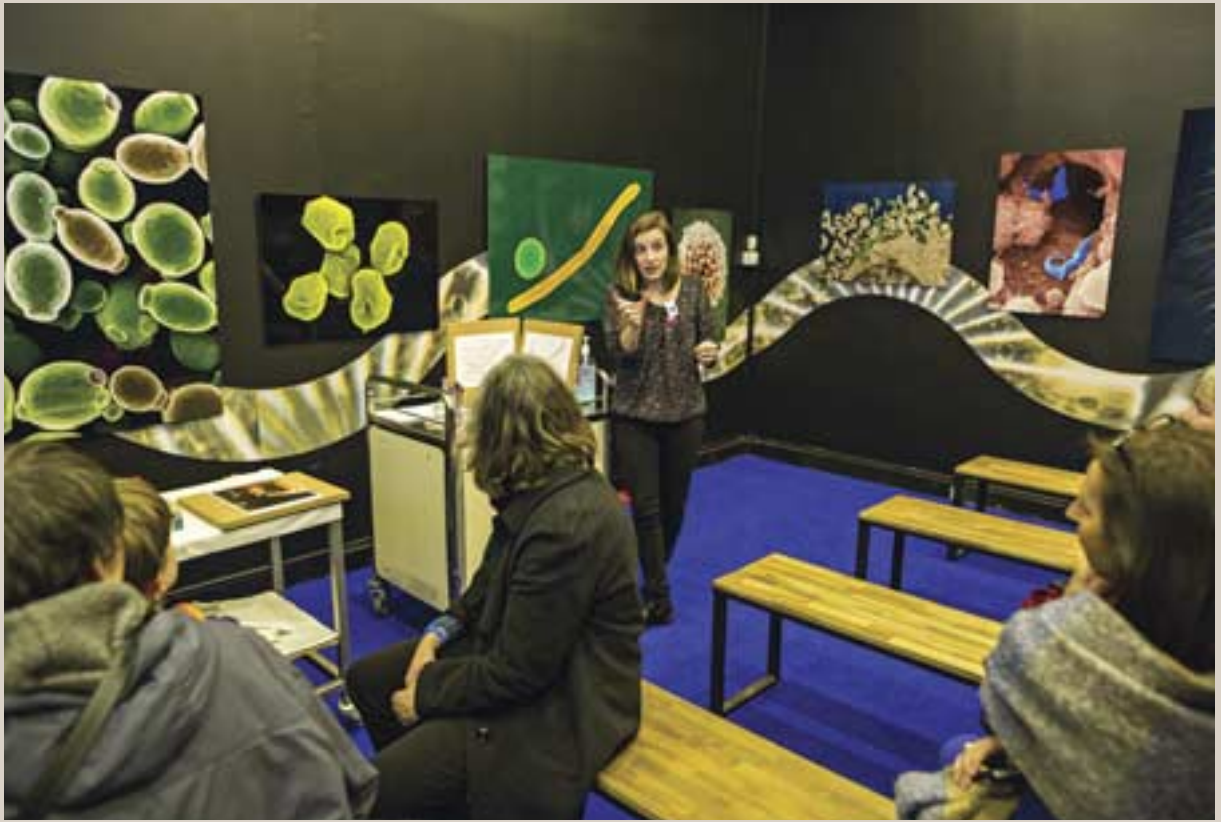
Exposé sur les vaccins au Palais en lien avec l'exposition Pasteur, l'expérimentateur présentée au Palais du 14 décembre 2017 au 19 août 2018.

y répondre, ce qui nécessite un positionnement différent du médiateur : « Le médiateur scientifique n'est pas là pour développer un discours, mais pour préciser la situation proposée, aider le visiteur dans sa démarche en lui posant des questions, ou lui permettre d'aller plus loin. » (2)