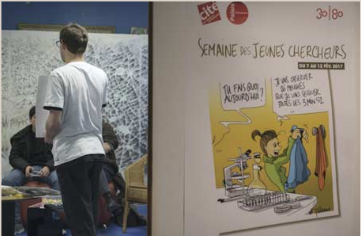
Jeune scientifique évoquant ses travaux de recherche face public lors de la « Semaine des jeunes chercheurs » au Palais du 7 au 12 février 2017.