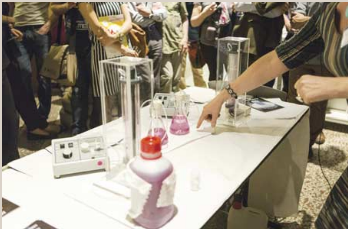
Exposé du programme Un chercheur, une manip « Lumière sur les nanosciences et les atomes froids » au Palais en 2015.